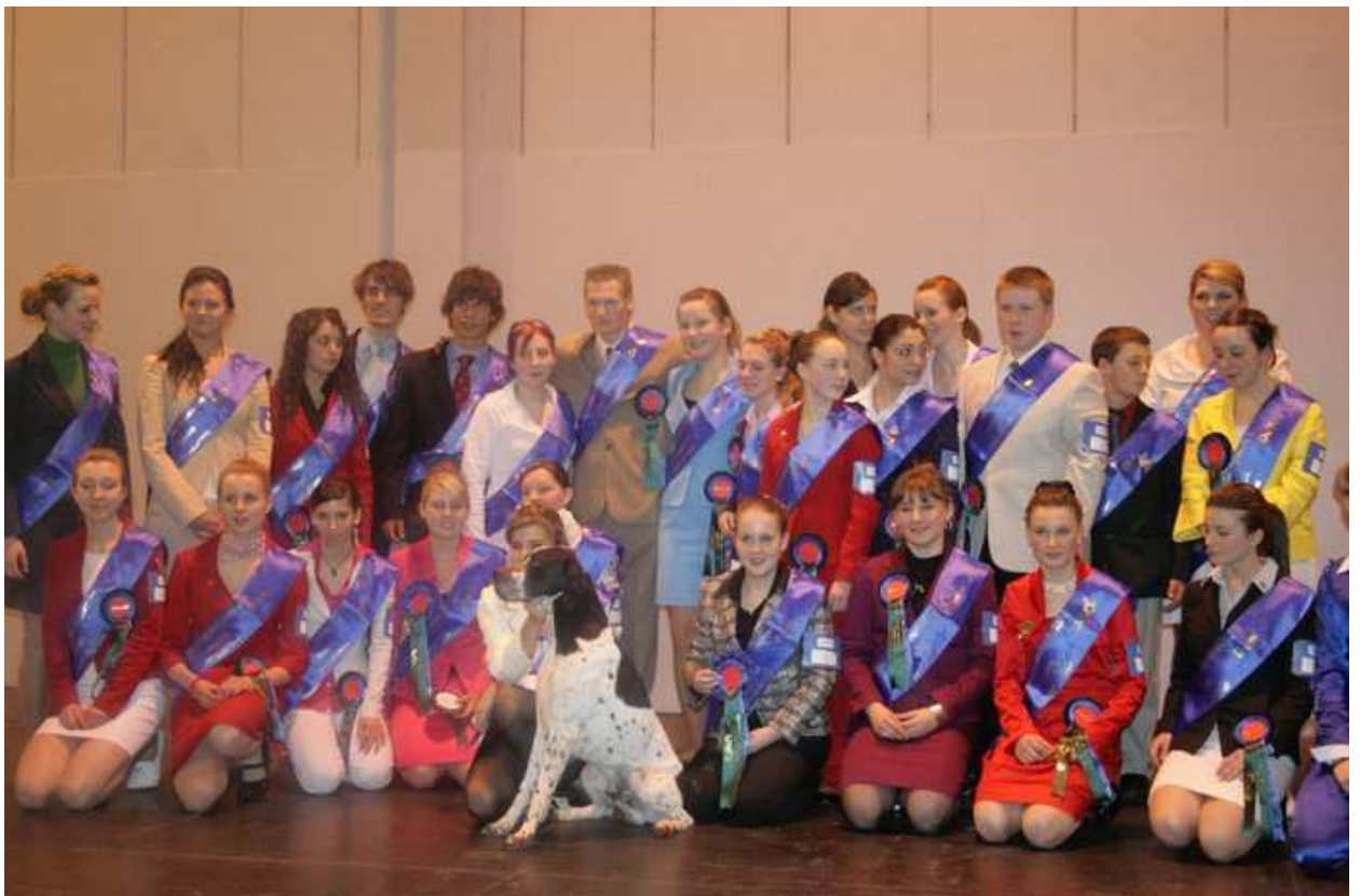
Společná fota - dole uprostřed 3 vítězky...