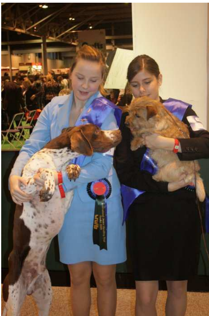
Přesně v 9 se museli všichni seřadit podle států a abecedy vedle sebe