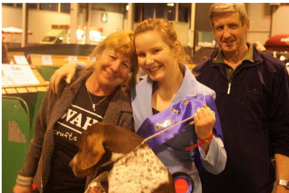
Chovatelé a majitelé Giorgia...