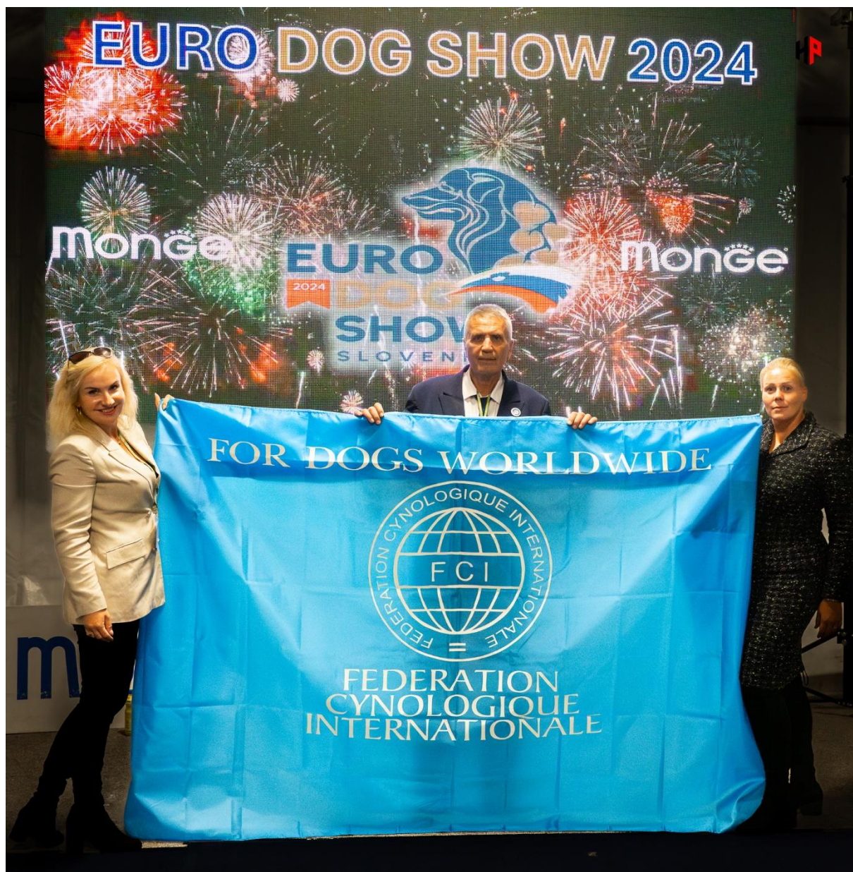
Zapsala: Kateřina Seidlová