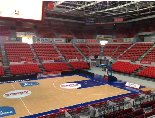
Foto “Interiér haly” - nízké tribuny zmizí. Zavěšená kostka (levý horní roh na fotce) bude ukazovat výsledek aktuálního týmu a průběžné pořadí. Live streaming na tabuli byl zavrhnut kvůli časovému zpoždění signálu.

Foto “Maketa haly” - pohled je zezadu, odkud budou vstupovat závodníci. Vstup pro ostatní je z druhé strany. Zvláštní vstup je pro akreditované osoby.